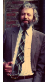
Charles George Broyden, Reino Unido, 1933-2011.